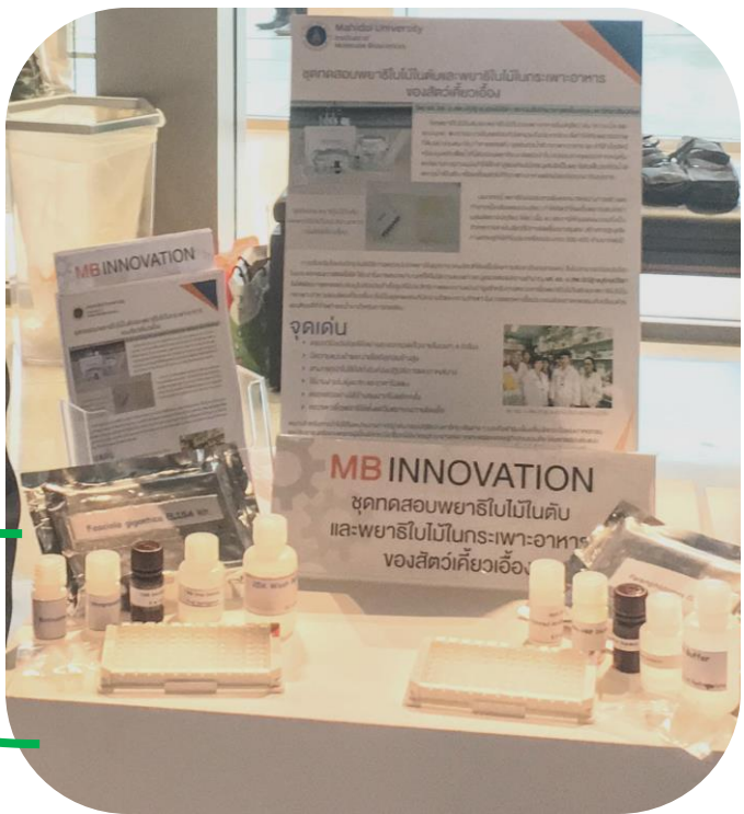
Immunodiagnostic test kits for fasciolosis and paramphistomosis in ruminants

รศ.ดร.น.สพ.ปณัฐ อนุรักษ์ปรีดา สถาบันชีววิทยาศาสตร์โมเลกุล มหาวิทยาลัยมหิดล